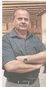
Gradnja hotela počinje u listopadu, a otvorenje će biti krajem 2015. godine

unaprijediti konkurentnost turističke ponude smještaja i održivog razvoja turizma u gradu i Varaždinskoj županiji. Nedvojbeno je da će novi hotel u samom središtu grada biti dodatni poticaj razvoju kvalitete turističkog proizvoda Varaždina. Od projekta gradnje hotela Park 4* očekuje se mnogo tim više što je riječ o trenutno jednoj od najvećih investicija u Varaždinu. Zahvaljujući Gastrocomu i sljedećih godinu dana poslije će biti za tvrtke i obrtnike koji se bave građenjem i opremanjem. Predstavlja rješenje projekta gradnje novog hotela nazočili su i predstavnici TZ Varaždina i turističkih agencija.