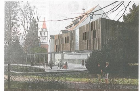
Budući hotel Park 4* trebao bi podići kvalitetu turističke ponude Varaždina ILLUSTRACIJA